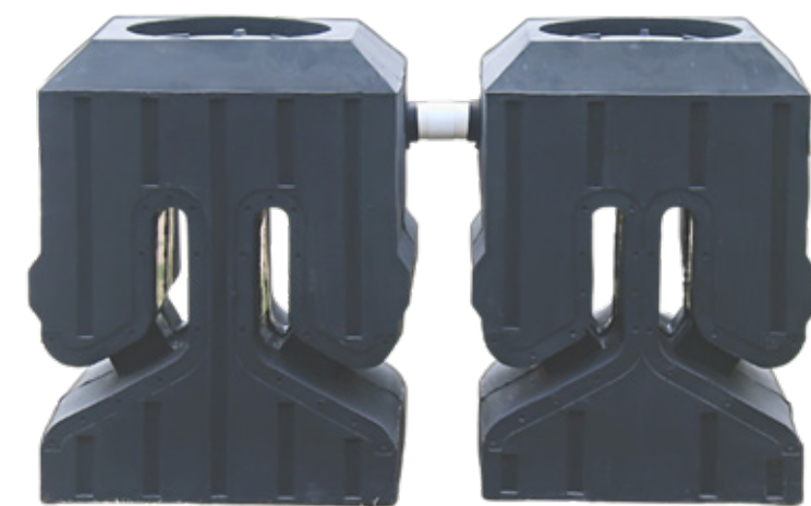
Figura 3. Sistema Individual de Tratamiento de Agua Residual (SITAR DLD14®) prefabricado en polietileno.

NOTA: Todos los sistemas de polietileno requieren de una plantilla de concreto para su nivelación, con un espesor mínimo de 5 cm. El sistema NO debe ser llenado con agua fuera de la excavación y sin estar debidamente instalado.